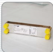
高效率板式冷热交换器 High efficiency SWEP heat exchanger