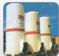
液态氮器可扩充装置 LN2 Injection System (Optional)