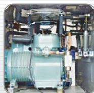
半密闭式大型压缩机组 Semi-Hermetical professional compressors