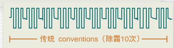
▲ 除霜时间 defrosts the time ▲