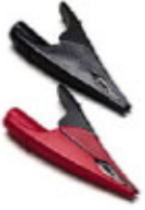
AC285-FL : 鳄鱼夹。