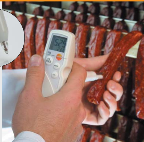
熟化处理中的持续质量监控