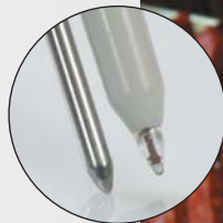
pH 探头，由防破裂塑料制成