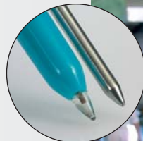
pH2 探头，测量半固态物质