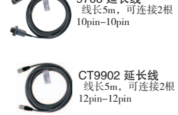
CT9900 转换线 10pin→12pin转换 CT9901 转换线 12pin→10pin转换 9706 延长线 线长5m, 可连接2根 10pin-10pin CT9902 延长线 线长5m, 可连接2根 12pin-12pin