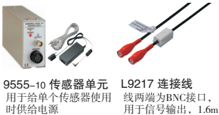
9555-10 传感器单元 用于给单个传感器使用时供电 L9217 连接线 线两端为BNC接口, 用于信号输出, 1.6m