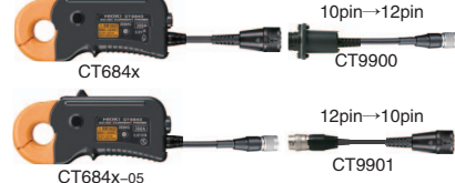
CT684x 10pin→12pin CT9900 CT684x-05 12pin→10pin CT9901