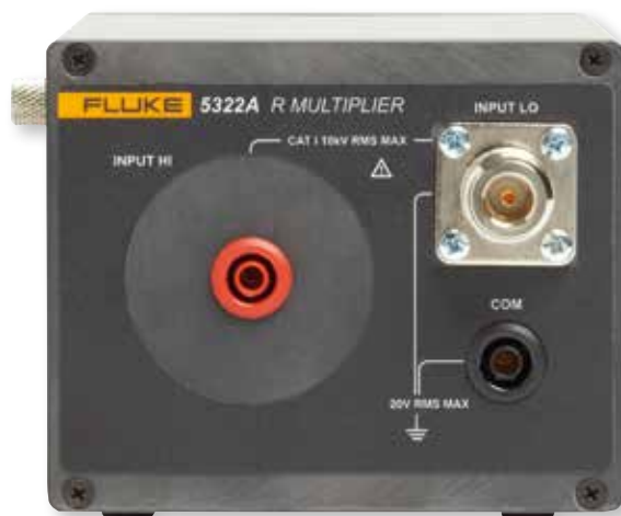
每台 5322A 都配有一个外部 R 倍增器, 用于输出测试绝缘测试仪所需的高达 10 TΩ 电阻。