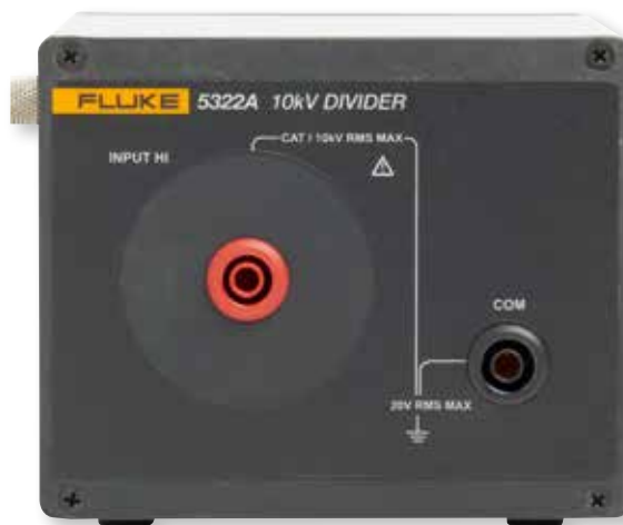
5322A 包括一个外部 10 kV 分压器, 用于测量具有 10 kV 输出的测试仪。