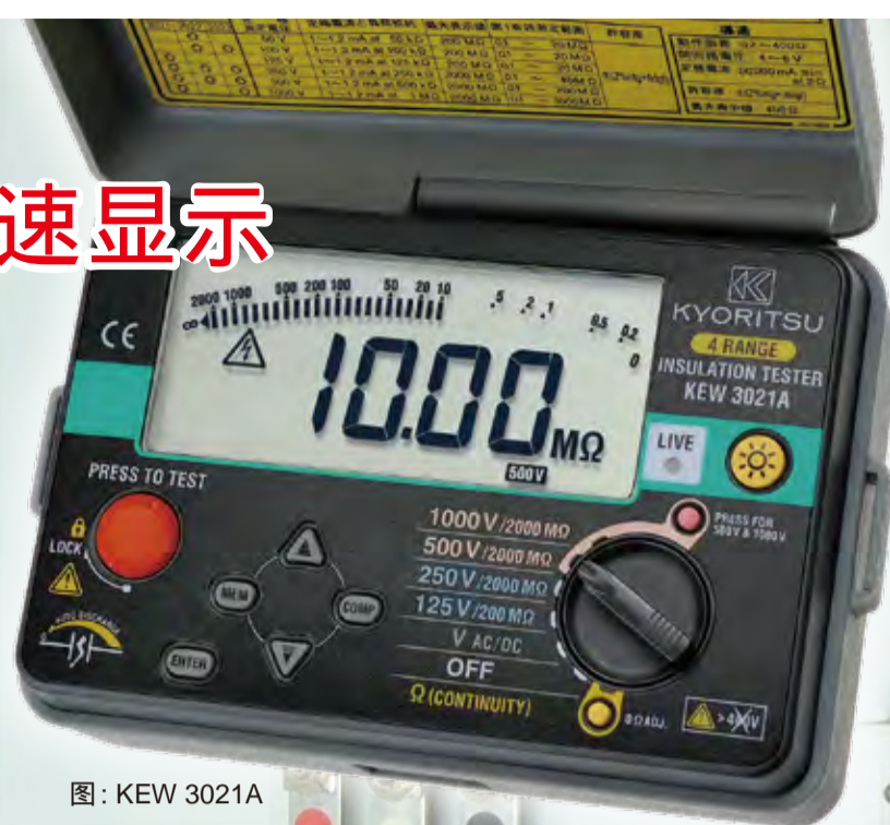
图: KEW 3021A