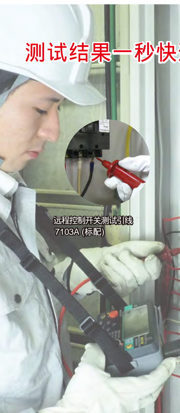
远程控制开关测试引线 7103A (标配)