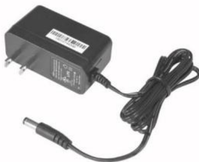
(Adapter) 100~240V: ASW-01