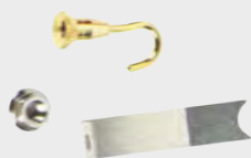
测试影响管用附件