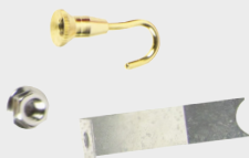
测试影响管用附件