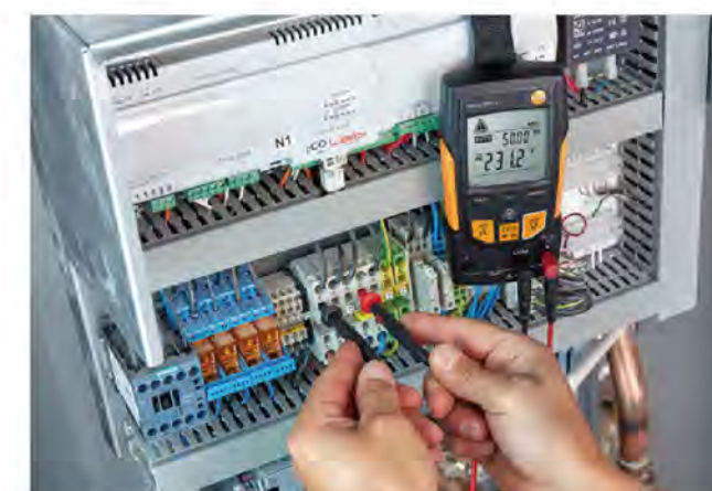
测量热泵开关盒中的电压