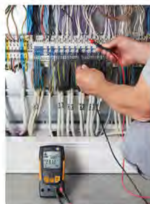
测量开关柜中的电压