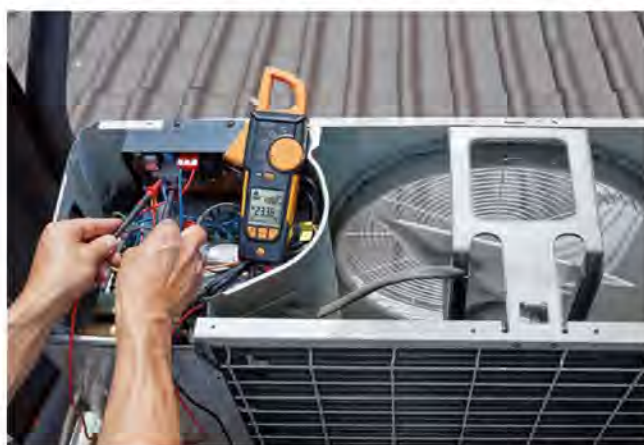
测量空调外机电压