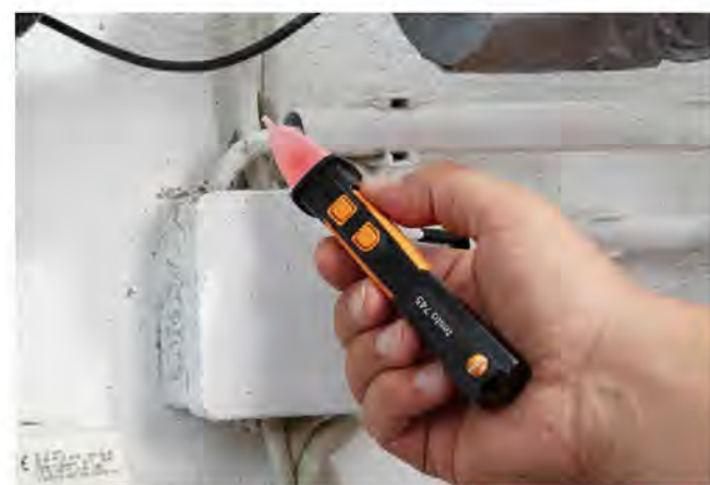
初步检测电源电压