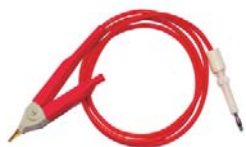
ZX8815Y01R 测试线 ● 适用于ZX8815系列 ● 红色高端线