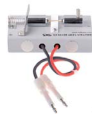
ZX28Y08B 具夹板概源申小 ●