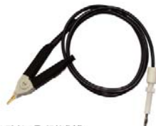
ZX8815Y01B 测试线 ● 适用于ZX8815系列 ● 黑色低端线