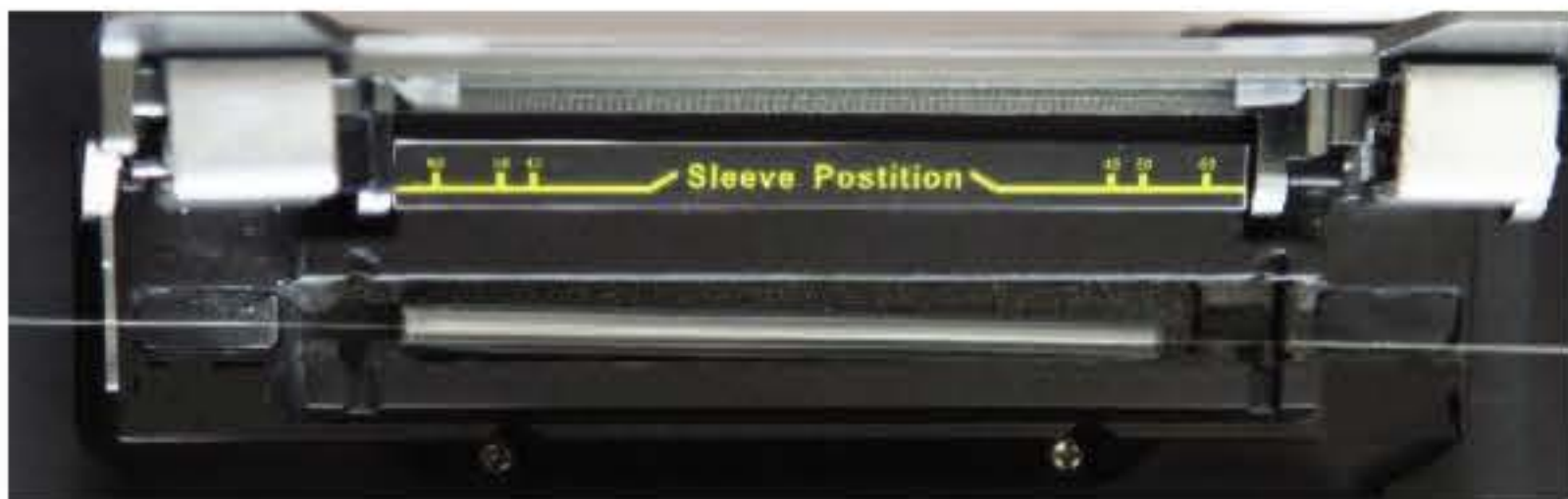
加热器及其探测单元

在加热器内增加探测元件，只有将热缩管放入加热器内，才会自动启动加热功能，防止误操作。