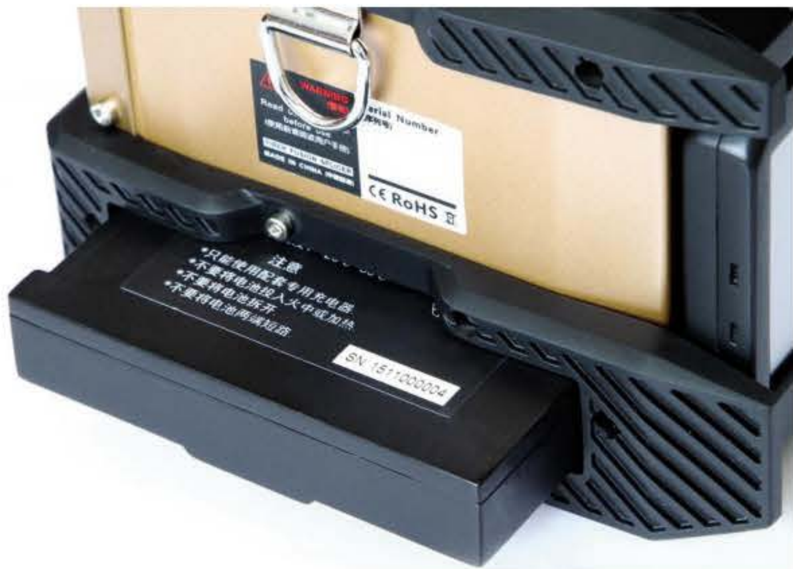
内置大容量可插拔锂离子电池

内置可自由插拔的大容量锂离子电池，充满电后可满足至少一整天（典型220次熔接和加热循环）的工作需求。