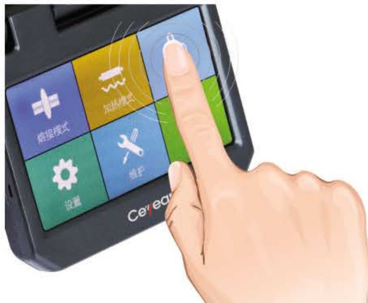
全新GUI图形界面及触摸屏设计

采用了全新的GUI图形界面和触摸屏设计。操作者可通过图像界面方便、直观地对机器进行相关设置和了解机器相关信息。