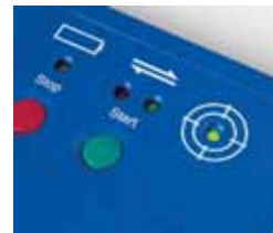
ET3 Smart Paq*