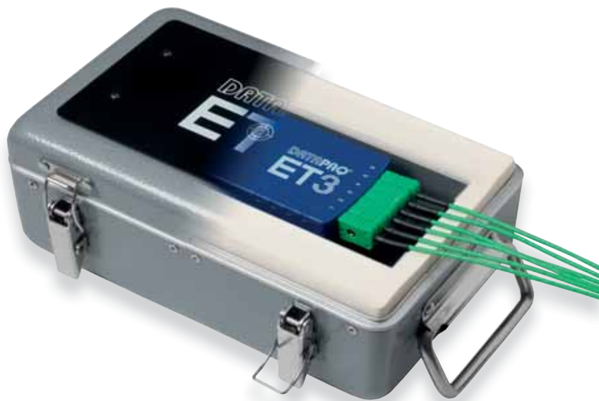
EasyTrack3 系统与标准 TB0253 隔热箱