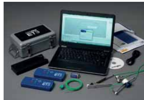
DATAPAQ EasyTrack3 系统