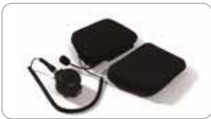
Nova 3® Talk™

RPB® Nova 3® Talk™是一种理想的无线通讯系统，适用于水槽、造船厂、水塔和难以进入区域的全体工作人员。