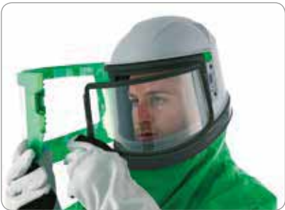
用带手套的手即可撕掉的面罩标签