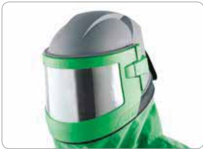
最佳下视和周边视觉