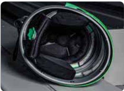
可调内部填充系统创建自定义适合