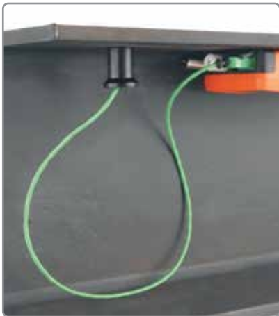
远程监控气候参数