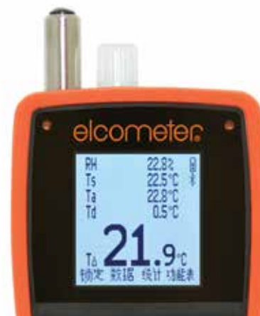
超大易读的测量数据，温度单位为°C 或 °F

BS 7079-B4, IMO MSC.215(82), IMO MSC.244(83), ISO 8502-4, US Navy NSI 009-32, US Navy PPI 63101-000