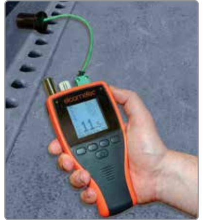
使用方便，菜单结构直观，多种语言可选

通过Bluetooth®蓝牙或USB连接易高319到电脑，Android™或iOS移动设备，和下载数据到检查应用程序或进入ElcoMaster®即时生成报告。