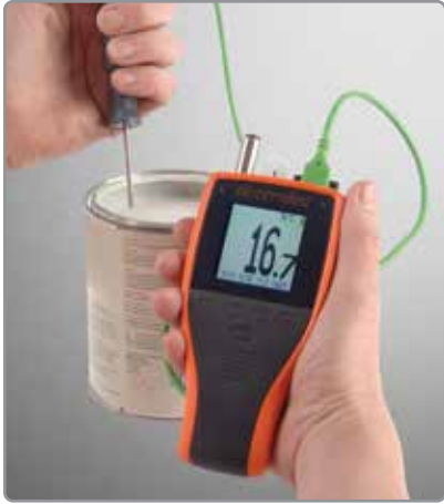
Te——适合用作单一温度计