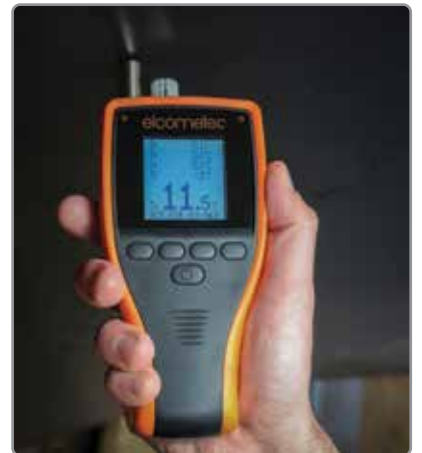
全密封传感器防尘防水（相当于IP66）