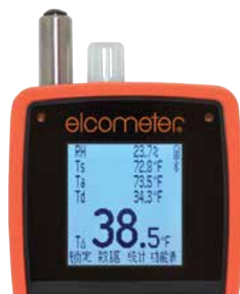
屏幕上查看多达5个用户可选的统计参数