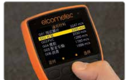
易于使用和需要最少设置