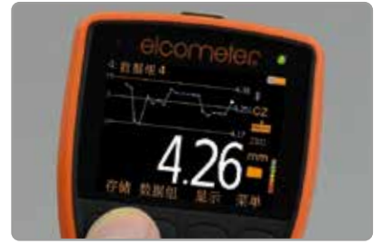
大容易阅读的显示和信号强度指示器

Elcometer 500通过Bluetooth®蓝牙无线传输读数,统计和数据组或者通过USB直入检查应用程序或进入Elcometer's移动应用ElcoMaster®,使用您的手机即时生成报告,无论是在你的办公桌或在外地。