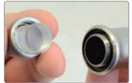
人体工程学的探头带可更换探头端部