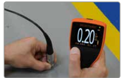
坚固可靠，适用于恶劣环境