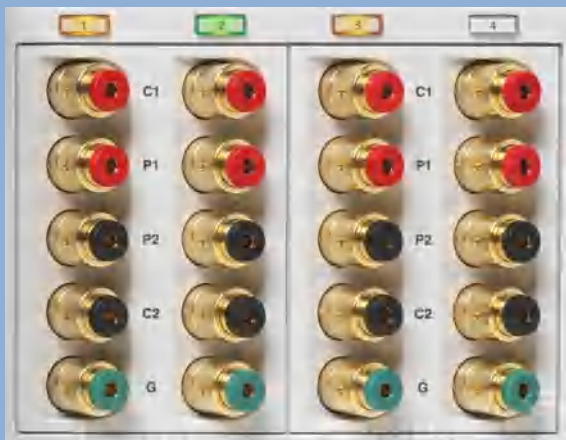
图 5. 通道选择键显示通道测量模式

3 按下专用的 setup 键和通道设置菜单，你可以查看或滚动到任何可用的通道(包括多路扫描开关的通道)。从传感器数据库中分配一支传感器给一个通道或创建一个新的传感器配置，可以容易地对测量通道进行配置。每通道可以独立设置输入类型，选择参考电阻，激励电流和测量显示方式（比率，欧姆或者温度）。