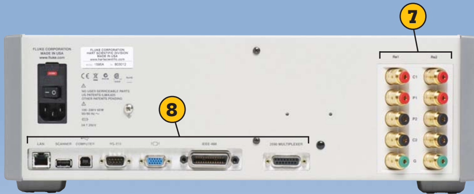
图4. 1594A 和 1595A 超级测温电桥的后面板