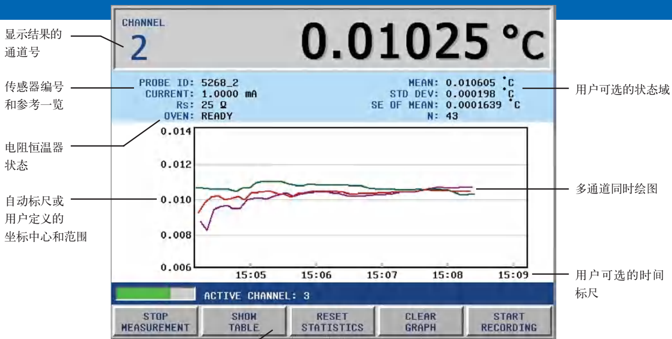
图 7. 图形模式