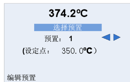
图二、可预置八个温度点自动升温保持

配合 XXXX 软件，使用电脑和 9118A 相连接就可以构成热电偶的自动校准系统。软件同时控制高温炉以及测温仪，从而起实现热电偶的全自动化检定。用户也可以根据自己的情况，手动控制 9118A 的温度点，然后操作测温仪表完成半自动或全部手动的操作。对于一些科研或者特殊应用非常方便。