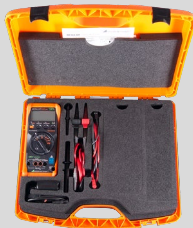
METRAHIT H+E CAR-Set