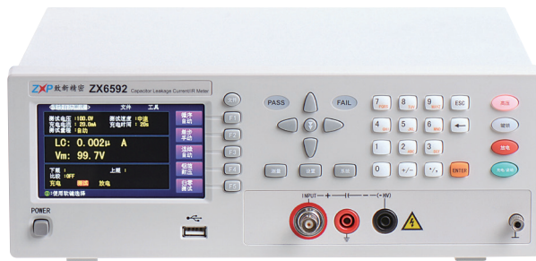
ZX6589 / ZX6592