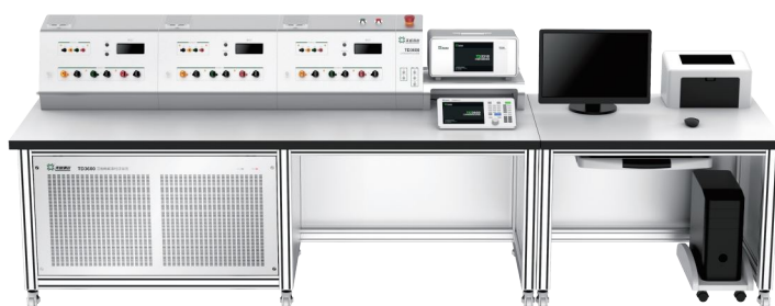
6 表位检定装置 (压接接线)