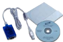
A1171 USB-RS232 转换器