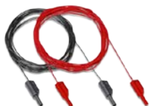
S2012 10米红、黑连续性测试线