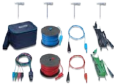
S2002 50 米接地测试导线