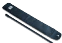
A1201 连续性测量绝缘杆