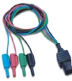
A1021 1 米 4 线测试线