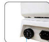
独立限温报警系统