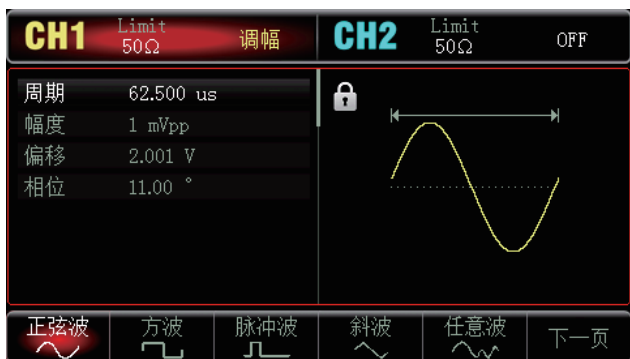
双通道多种波形可供选择