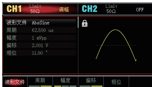
24种非易失数字任意波形存储