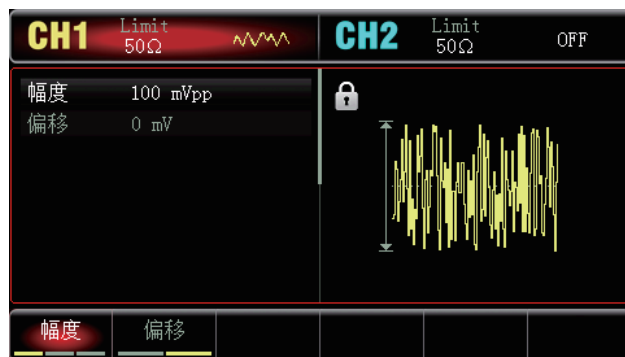
具有固定带宽40MHz的噪声信号