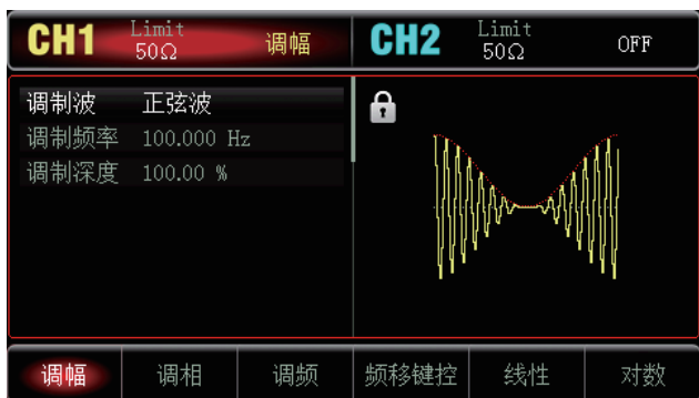
简单易用的调制类型