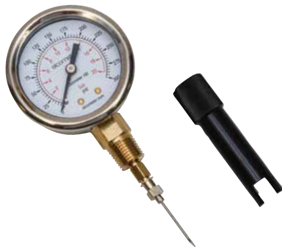
如何使用针式压力计