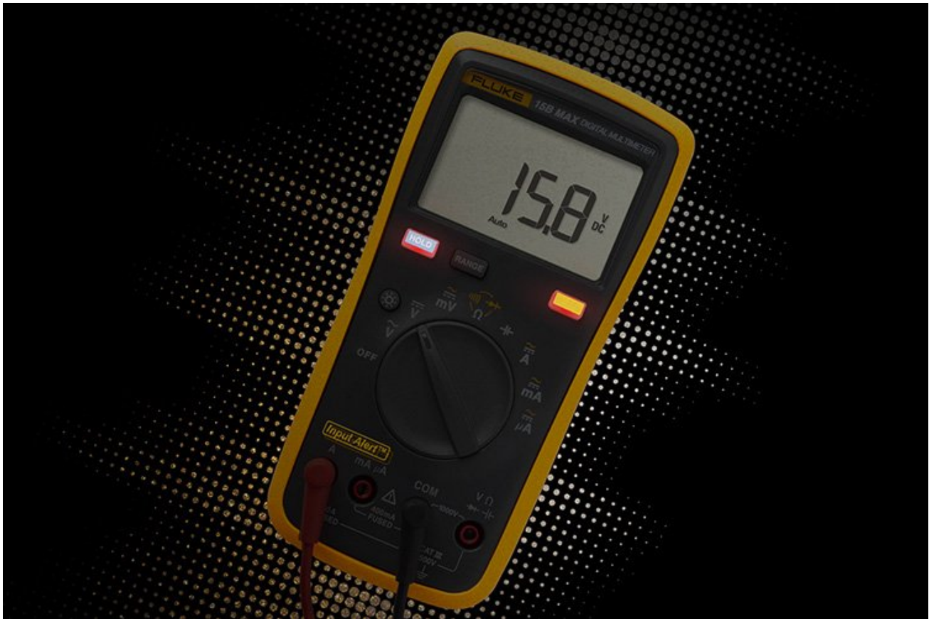
误操作声光报警，减少保险丝损坏