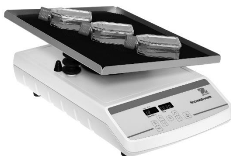
图 4-3 (带塑料器皿的数显控制摇摆式摇床)