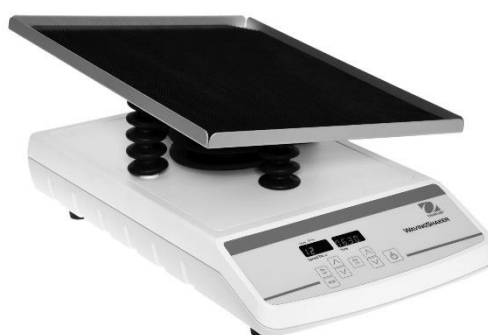
图 4-4 (数显控制波动式摇床)