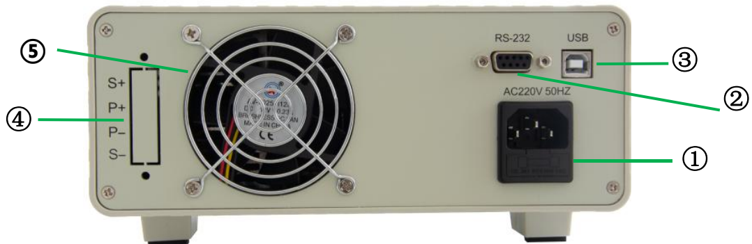
图 2.3.1 ASD906B 后面板

ASD906B 模拟电池后面板含设备电源插座（带保险丝）、通讯接口、远程输出端子和散热窗口，如图 2.3.1 所示。