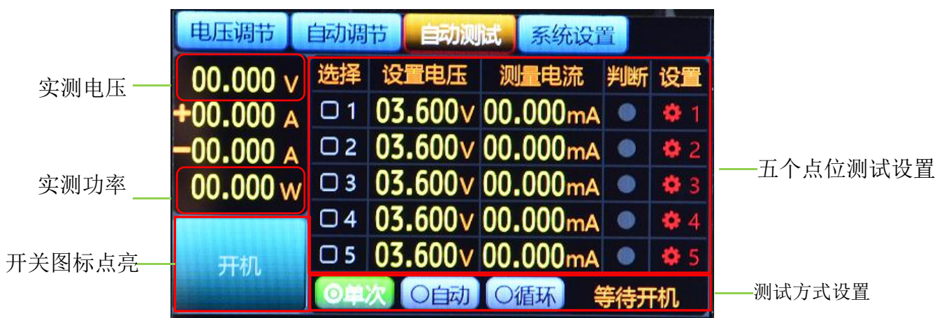
图5.6.1 电池充放电自动测试

此时ASD906B的LCD屏开关按钮显示为粉红色，参数显示区显示电池的充电电压值、电流值及功率值，如图5.6.1所示。