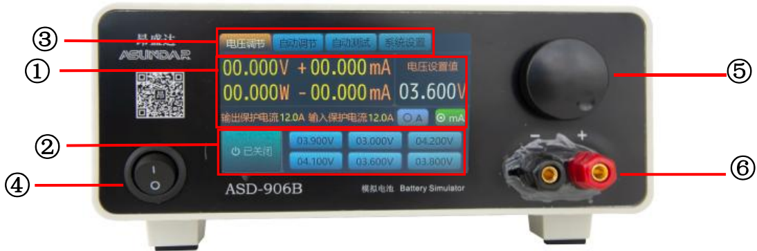
图 2.2.1 ASD906B 前面板

开关按钮(ON/OFF)用于开启或关闭模拟电池设备，红黑接线柱为模拟电池（Battery）输入和输出的电能传输接口；LCD触摸显示屏含参数设置，参数显示，菜单设置及开关等功能；调节旋钮（带触压按键）可微调电压或电流参数。操作详情见第五章。