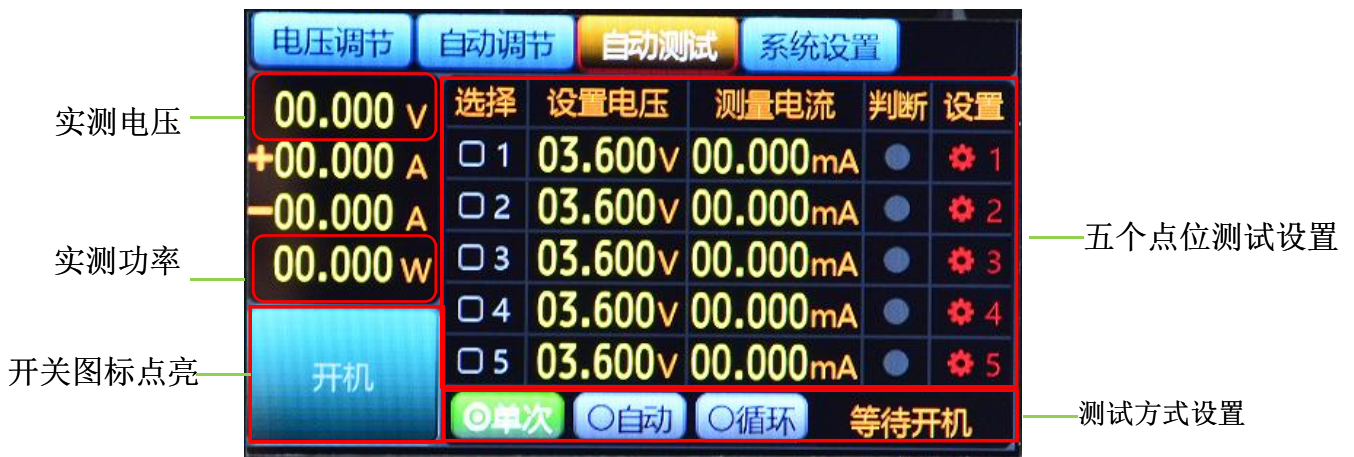
图5.6.3 电池自动参数启动设置

通过完成电池自动参数单步设置，根据具体测试方法选择，这里以单次测试为例，点击LCD屏上开关按钮。启动测试，自动测试会在产品连接重新接入后开始测试，方便产品测试。循环测试，产品需要不同点位一直老化测试或是其他用到此项，可选择该项进行测试。如图5.6.3所示。