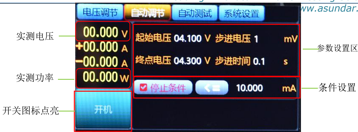
图5.5.1 电池充电饱和和测试