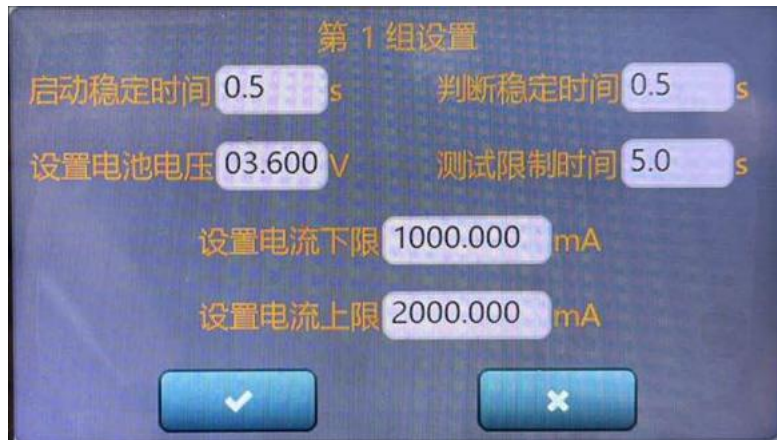
图5.6.2 电池自动参数单步设置

试过程，启动稳定时间0.5s，判断稳定时间0.5s，设置电池电压3.6V，测试限制时间为5.0s，为具体测试时间，电池该具体测试点总共花费6.0s时间。根据具体充电电流，设置充电判断范围。如图5.6.2所示。