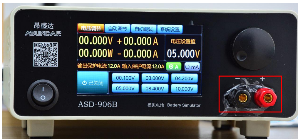
图 6.1.1 模拟电池前面板