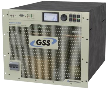
带有人机交互界面 (HMI) 的TC.GSS系列