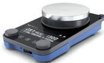
IKA Plate (RCT digital) 加热磁力搅拌器 订货号 0025004975

以下 IKA 产品可以更好的配套 IKA FLOW System 微通道反应器的使用: