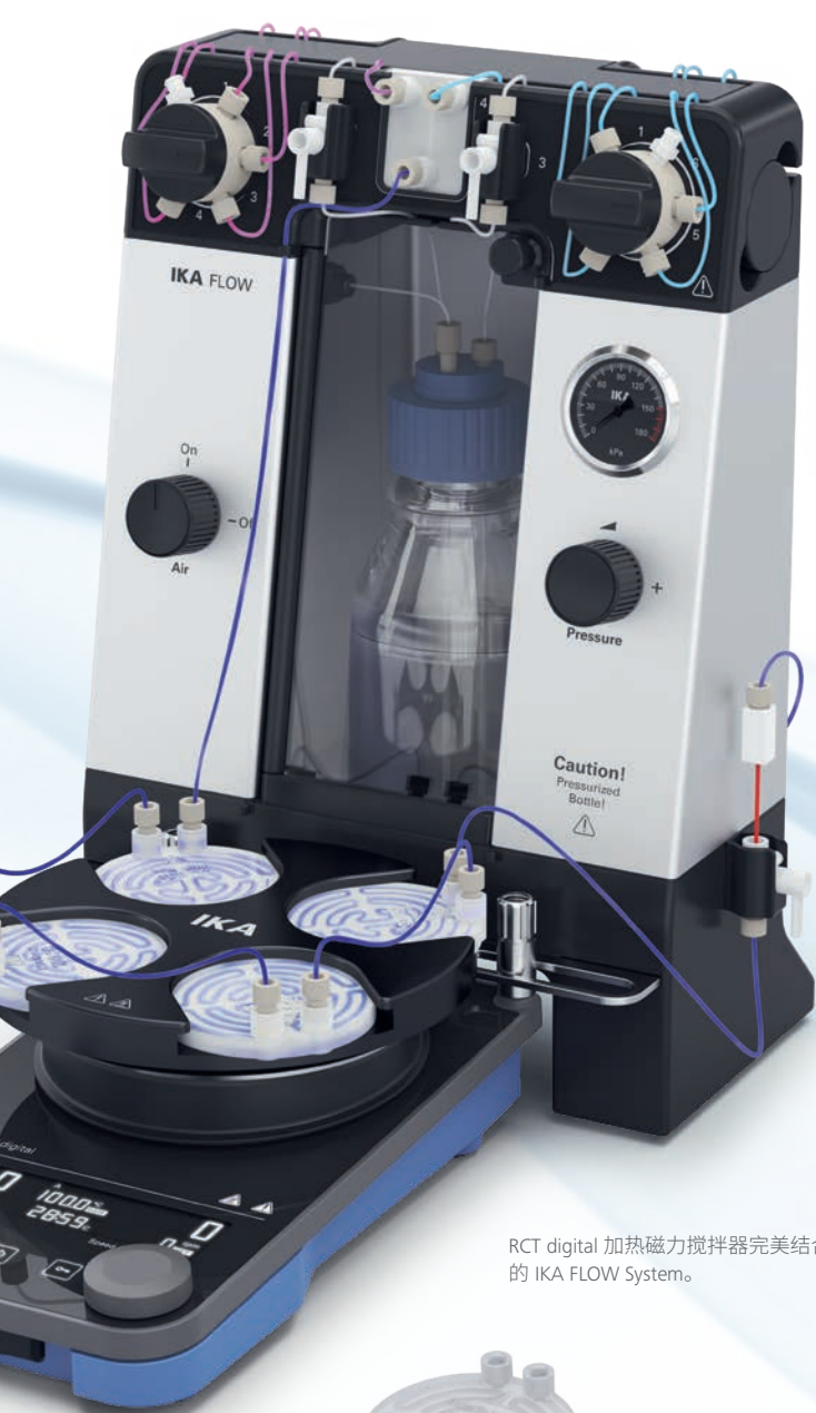
RCT digital 加热磁力搅拌器完美结合您的 IKA FLOW System。