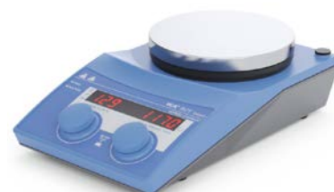
RCT basic 加热磁力搅拌器 订货号 0020002190