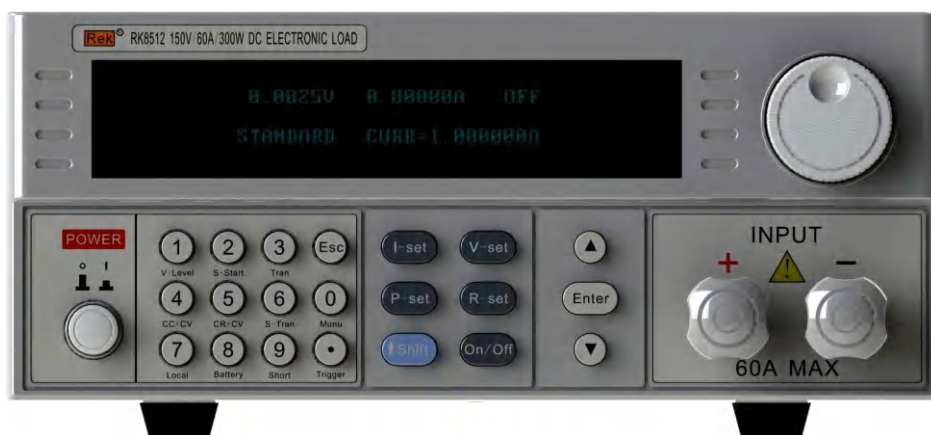
图 3.1 前面板图

RK8511 系列电子负载的前面板外观如下图所示（图中所示为 RK8512，RK8511 与之相同，仅上部的 PVC 印制内容有差异）：