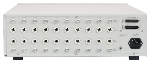
10通道并行耐压扫描盒（选件）