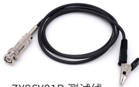
ZX96Y01B 测试线 ● 适用于耐压测试仪 ● 黑色低端线