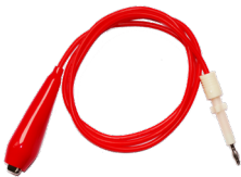
ZX95Y02R 测试线 ● 适用于耐压测试仪 ● 红色高端线