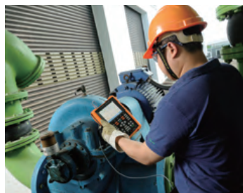
图2. 户外模式在阳光直射下仍可清晰显示

在户外执行现场工作时，用户可通过一组功能键轻松切换到这个查看模式。该模式采取防炫射设计；它能够过滤多余的阳光，从而减少误读或误解测量读数的风险。