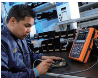
图1. 室内模式可提供清晰的读数

室内模式拥有很高的对比度和亮度，以便清晰地区分在室内光环境中的波形。仪器配置了VGA TFT LCD显示屏，可让用户在广角显示屏中查看读数，从而更高效地完成故障诊断任务。