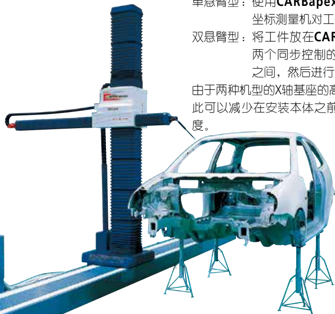
CARBapex 601624 (单悬臂型)