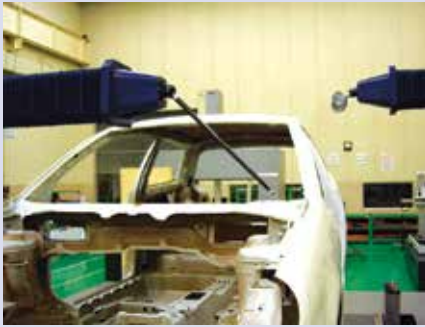
双悬臂型的测量实例 (配有接触式触发式测头和线性激光测头)