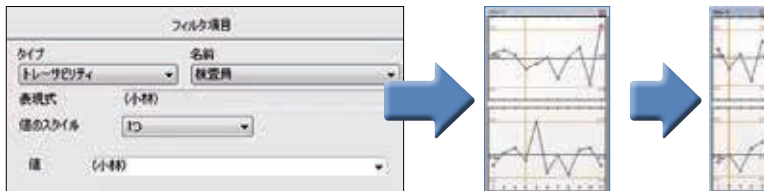
检索项目选择菜单