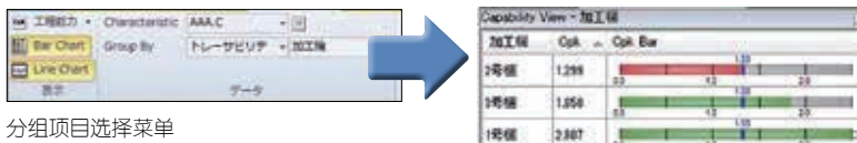
分组项目选择菜单