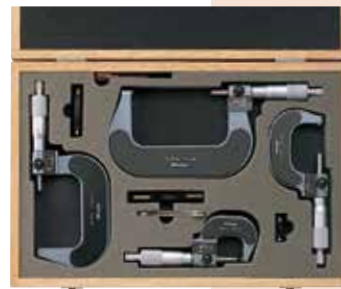
193-916 M820-100ST 标准套装