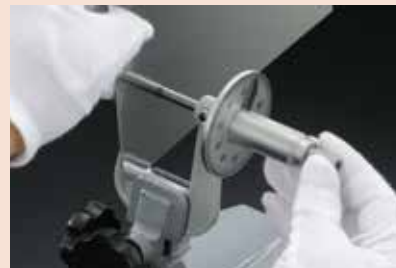
■标准附件 扳手(No.200168) 1件