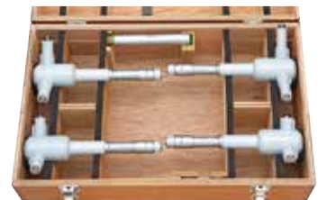
标准配件(独立包装) 设置环规套装(ø125, ø175) 368-994 HT2-200RST