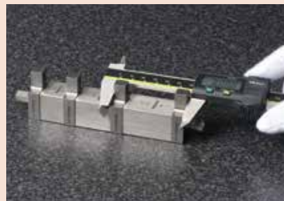
使用平头螺钉、拉杆、滚花螺钉(方形量块)