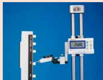
高度卡尺精度检查