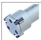
6-50mm区间测量头主体为铜材质的圆形型头