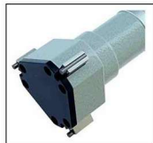
50-100mm区间测量头主体为铝材质的三角型头