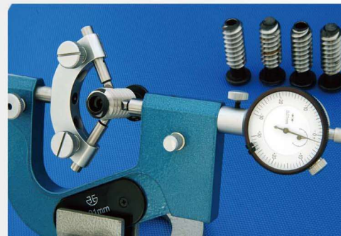
比较测量螺纹中径