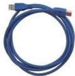
USB 3.0 传输线