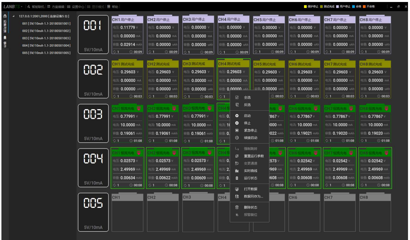
LANBTS 电池测试系统监控界面