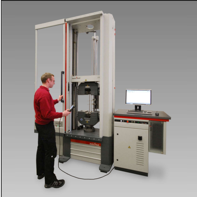
Z400E mit Hydraulik-Probenhalter