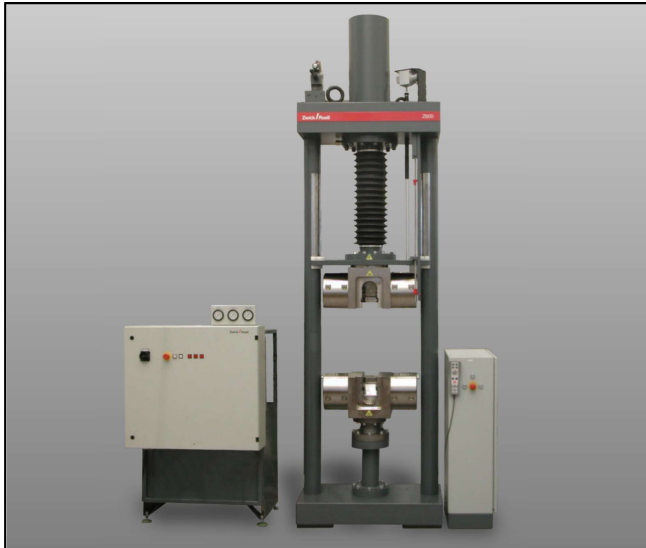
ZwickRoell Z600H mit Hydraulik-Probenhalter