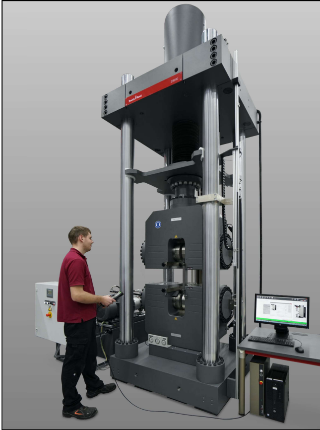
ZwickRoell Z3000H mit Hydraulik-Probenhalter