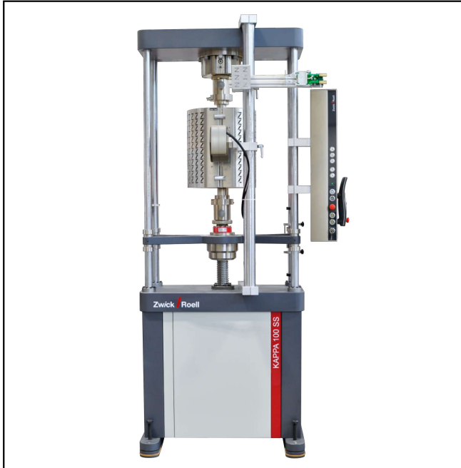
Kappa 100 SS