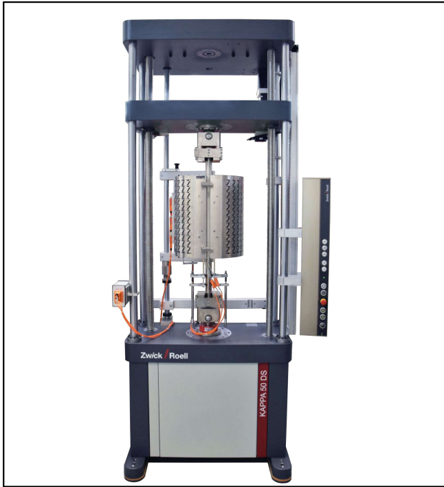
Kappa 50 DS