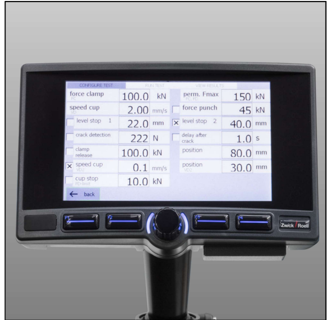
Display für BUP 100 / 200 (1048582)