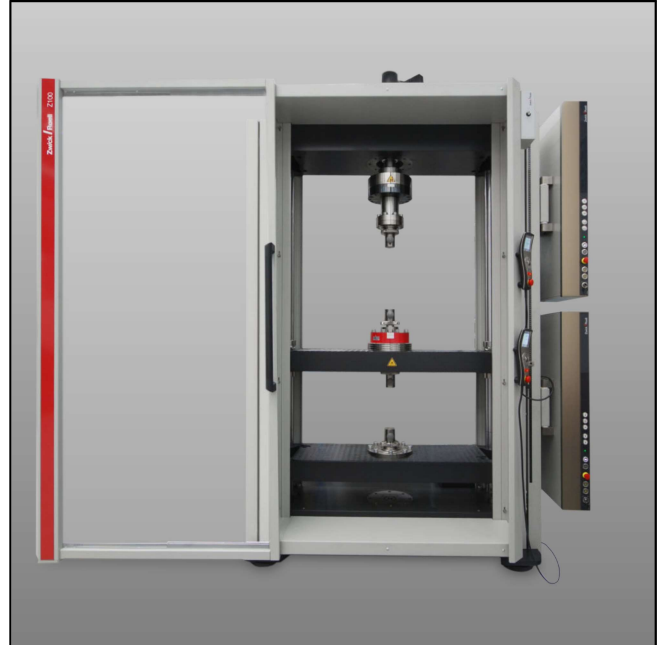
Stand-Prüfmaschine mit Torsionsantrieb